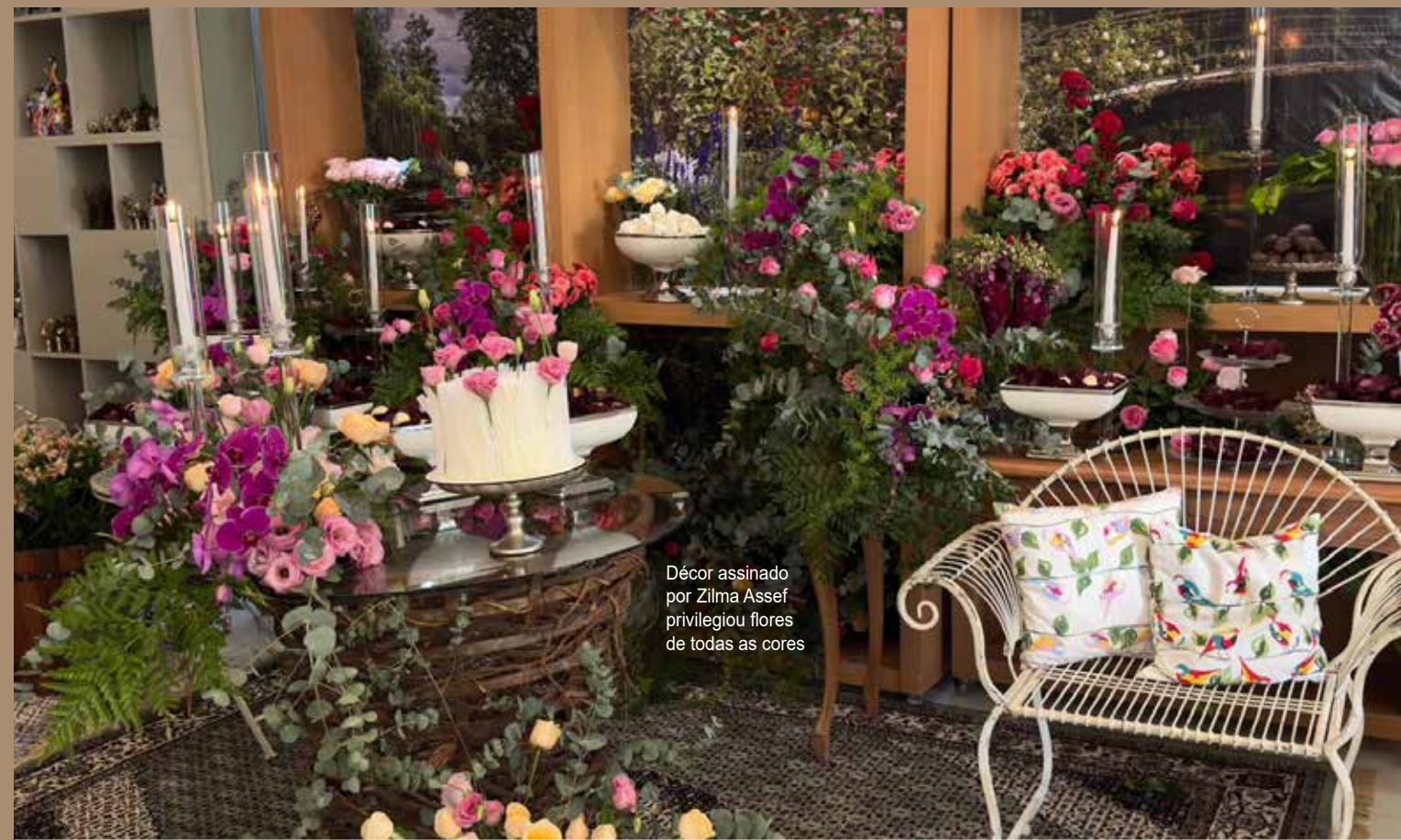
Décor assinado por Zilma Assef privilegiou flores de todas as cores