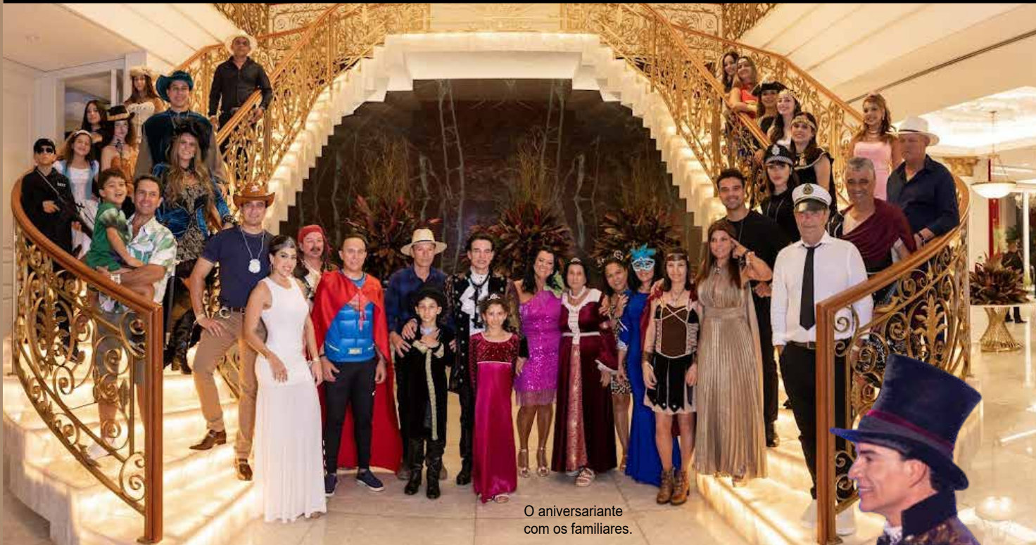
O aniversariante com os familiares.