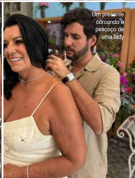
Um presente corando o pescoço de uma lady