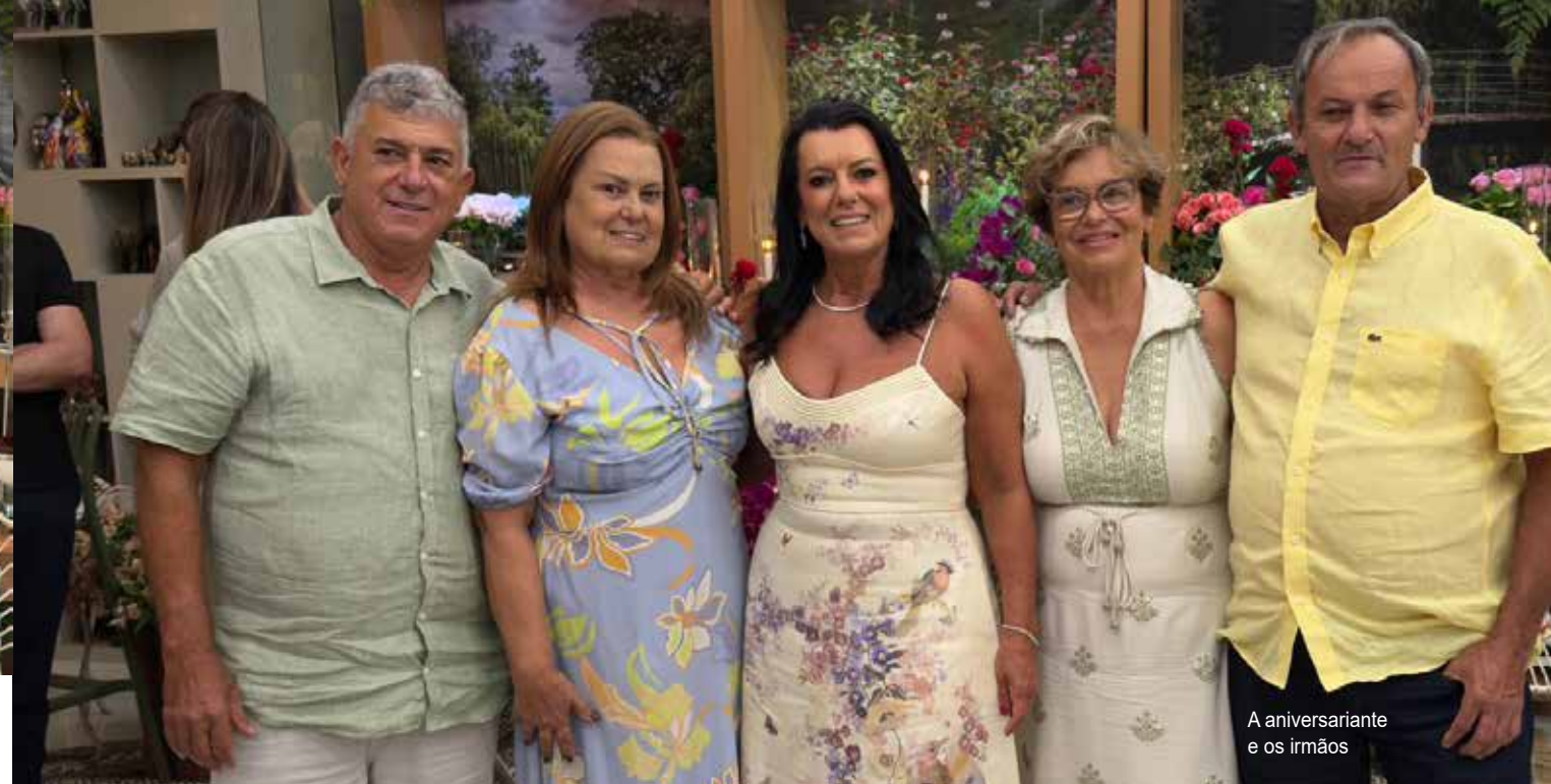
A aniversariante e os irmãos